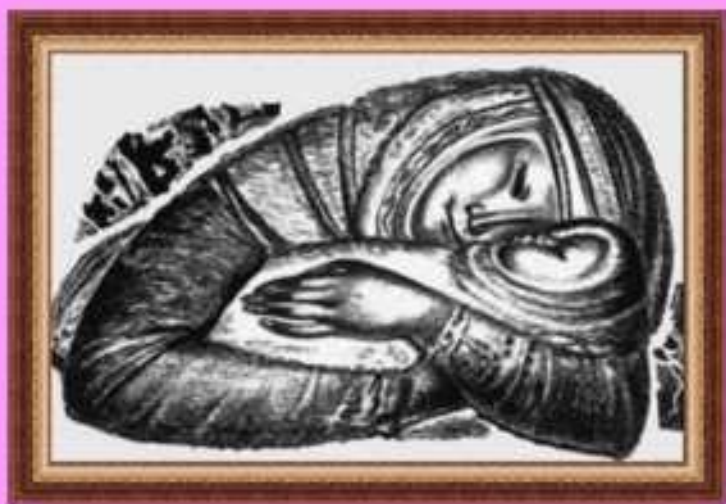
Е. Сидоркин. Колыбельная.

На картине Б. Неменского «Тишина» рука матери охраняет сон малыша.